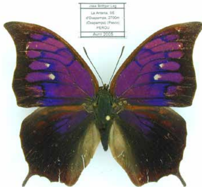
Figura 7. Ejemplar macho de Muysmondia tyrianthina (G y S) de Perú, con prolongación caudal en cada ala posterior