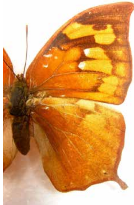
Figuras 1-2. Anverso dorsal derecho de Fountainea centarurus (Fldr) ♂, ♀