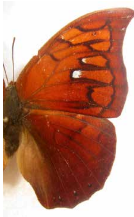
Figuras 3-4. Anverso dorsal derecho de Muyshondtia tyrianthina (S y G) ♂, ♀