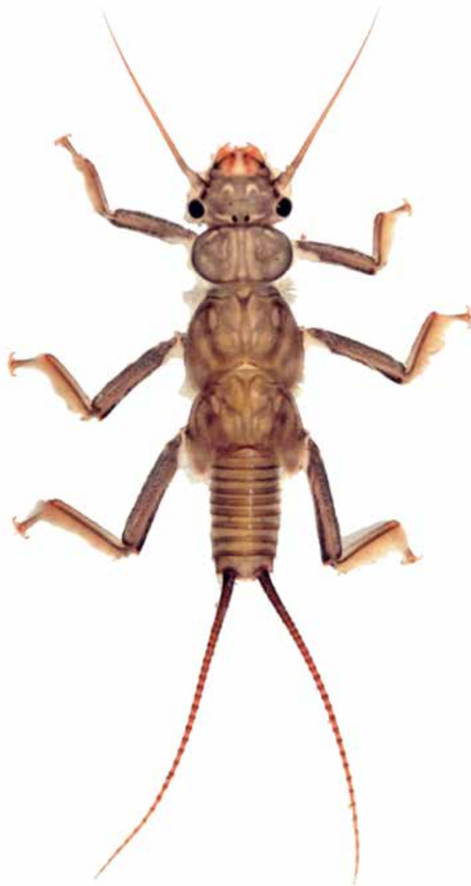
Plecoptera: Perlidae .