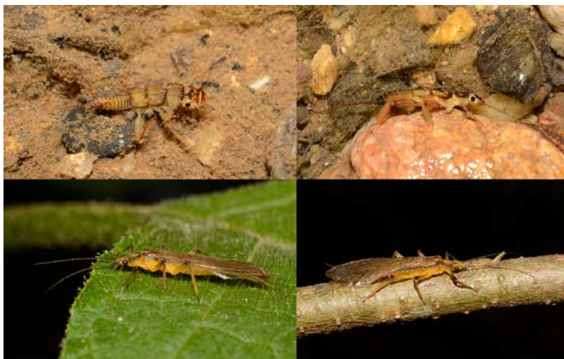
Imagen 1. Plecoptera: Perlidae.