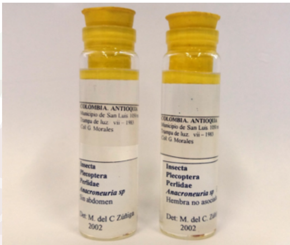
Imagen 2. Colección Perlidae MEFLG.